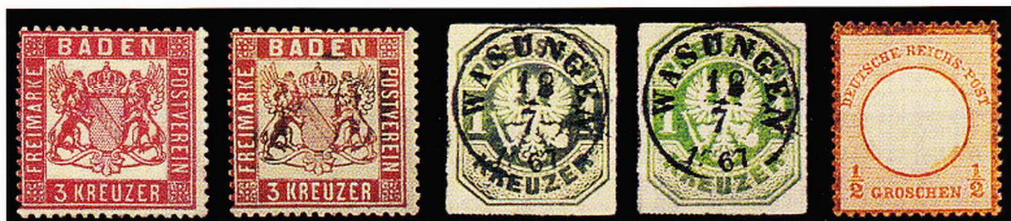
Bleisulfidschäden der Kategorie I (Beispiele, Pos. 1 und 4 Originalfarben)

1) Wir kennen klassische Marken, die aufgrund ihrer Farbzusammensetzung zur „Oxydation“ neigen, vor allem Orange-, Gelb- und Rottöne. Bei diesen Marken waren in gewissem Umfang auch in der Vergangenheit Verfärbungen zu beobachten, wobei für die Veränderungen wohl in aller Regel unsachgemäße Lagerung, beispielsweise Feuchtigkeits- oder Temperatureinflüsse, verantwortlich waren. Seit etwa 1975 häuften sich farbveränderte Marken nach Lagerung unter PVC-Folien in besorgniserregendem Maße. Hinzu kamen jedoch neu auch Veränderungen anderer Farben wie Blau- oder Grüntöne. In allen Fällen konnte beobachtet werden, dass die Markenfarben dunkler wurden, vielfach bis zur völligen Schwarzfärbung. Weiter ließ sich beobachten, dass sich bestimmte Marken unter weitgehend luftdicht abgeschlossenen PVC-Folien grundsätzlich nach kurzer oder längerer Zeit verfärbten, während sie bei anderer Aufbewahrungsart, beispielsweise in handelsüblichen Klemmtaschen auf Albumblättern aus Karton oder etwa in Einsteckbüchern, keinen Schaden nahmen.