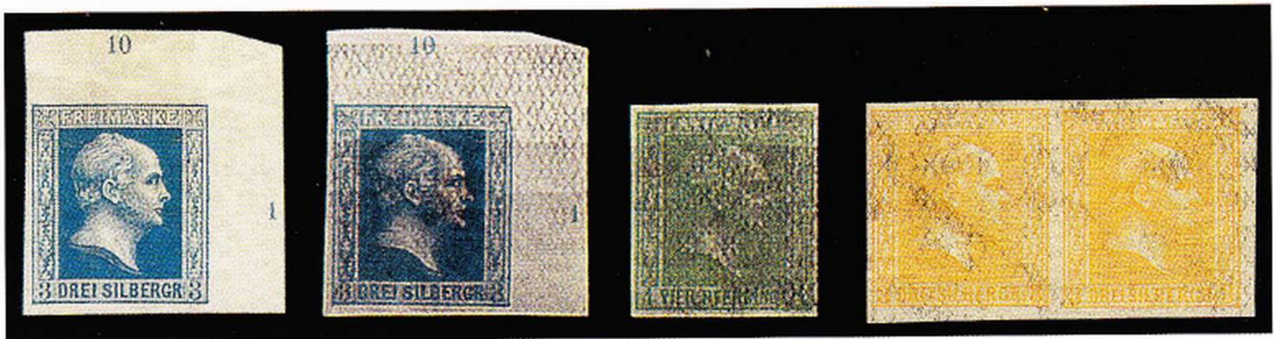
Typische Bleisulfidschäden der Kategorie III (Pos. 1 Originalzustand)

III) Die dritte Gruppe beeinträchtigter Marken betrifft Ausgaben, die als Fälschungsschutz mit einem normalerweise nicht sichtbaren Unterdruck versehen wurden (beispielsweise preußische Marken der zweiten und dritten Ausgabe oder bestimmte Marken des Norddeutschen Postbezirks). Dieser Unterdruck tritt in der Regel nur durch chemische Manipulation (z.B. durch Schwefelwasserstoff) schwarz oder braunschwarz zu Tage und führt dann zu einer erheblichen Wertminderung der betroffenen Marke. Auch hier konnte in den letzten Jahrzehnten eine extreme Häufung geschädigter Marken festgestellt werden.